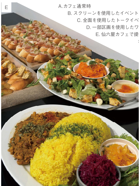
A. カフェ通常時 B. スクリーンを使用したイベント C. 全面を使用したトークイベント D. 一部区画を使用したワークショップ E. 仙六屋カフェで提供しているオードブル